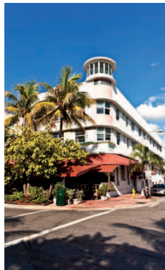
Restaurante latino, carabiene și americane populează Miami

45 de apartamente spațioase, cu vedere către ocean. Iar dintre atracțiile turistice, nu trebuie să ratați Castelul de Coral, o construcție nemaipomenită întruchipind dragostea, proiectată și realizată de un singur om: Edward Leedskalnin. Dacă tu și iubitul tău sînteți amatori de sport, atunci parcul Oleta River State este locul ideal. Aici puteți închiria biciclete și chiar face caiac-canoe. Desigur, Miami Beach este cea mai spectaculoasă și circulată zonă din oraș, unde veți găsi restaurante, baruri, magazine și cluburi, toate umbrite de palmieri imenși și multe dintre ele amplasate chiar pe plajele cu nisip fin.