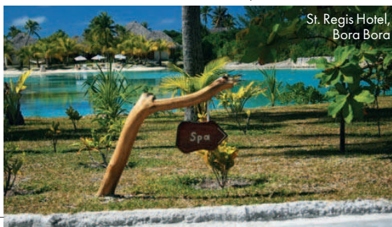
St. Regis Hotel, Bora Bora

Vacanța tropicală abia începe pe insula Bora Bora, unde este indicat să mergeți în perioadele decembrie-ianuarie și iulie-august. Dacă sunteți amatori de sporturi acvatice și nautice, aici este locul perfect pentru a încerca jet ski-ul sau scuba-diving, dar și o excursie de snorkeling, unde veți avea ocazia să admirați corali, pisicile de mare sau peștii viu colorați. Petreceți cele zece nopți de vis la Four Seasons Hotel sau St. Regis Resort, situat pe insula Motu Ome'e, unde vă veți bucura de vederi spectaculoase asupra vârfului Otemanu. Centrul spa „Miri Miri”, parte a Starwood Spa Collection, a fost nominalizat în „Top 15 to watch”, întocmit de publicația Travel + Leisure Magazine . Este situat pe propria insulă și oferă tratamente exotice folosind produse cosmetice pe bază de perle și ulei de alge. Ce-ți poți dori mai mult?!