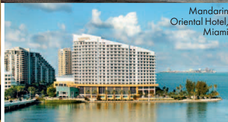
Mandarin Oriental Hotel, Miami