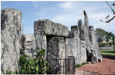
Castelul de coral (Miami), proiectat de Edward Leedskalnin