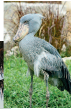
Pasărea cap de balenă este una dintre atracțiile insulei St. Lucia