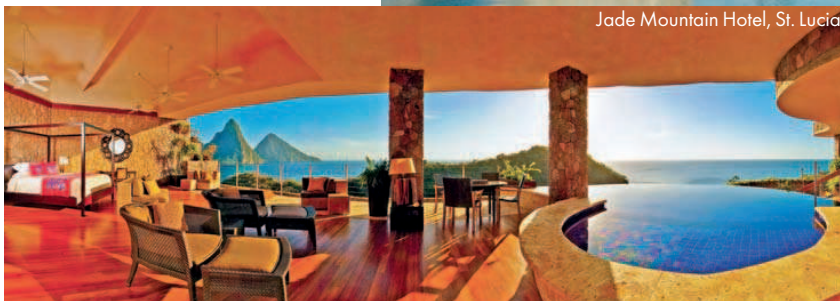
Jade Mountain Hotel, St. Lucia