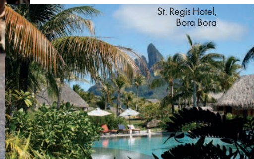
St. Regis Hotel, Bora Bora

rati împreună priveliștea încântătoare asupra orașului din Griffith Park, acolo unde se află și faimoasa siglă Hollywood. E locul perfect pentru un sărut pe care nu-l veți uita prea curând!