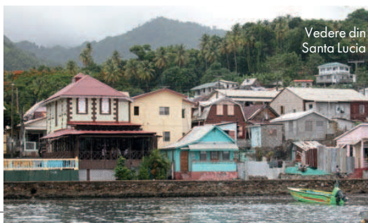
Vedere din Santa Lucia