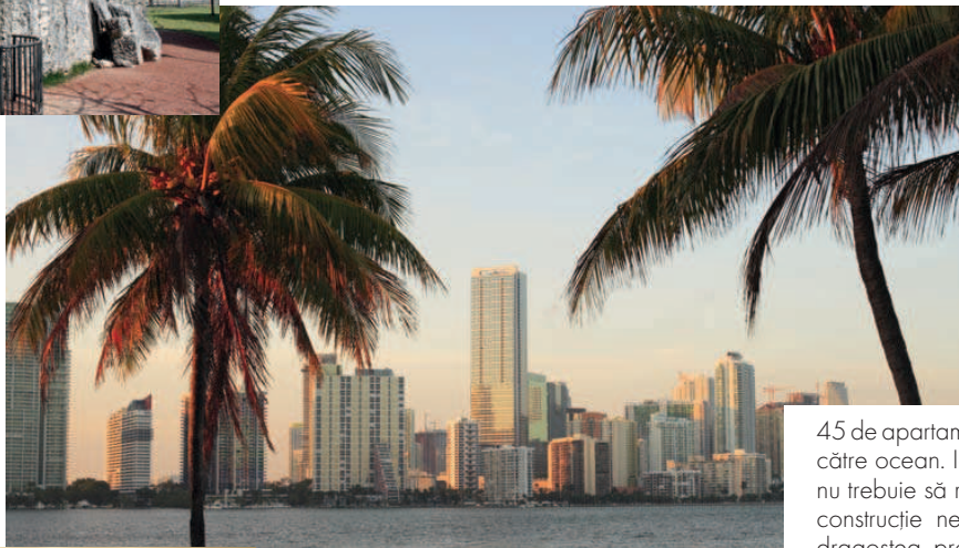
Miami, o destinație exotică și multiculturală