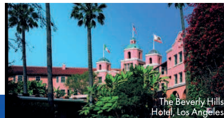
The Beverly Hills Hotel, Los Angeles