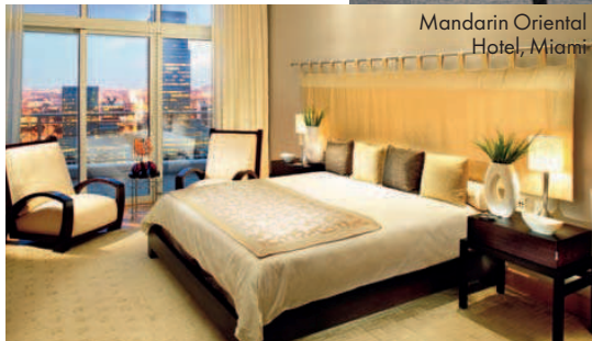
Mandarin Oriental Hotel, Miami