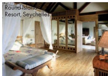
Round Island Resort, Seychelles

le recomandăm o vizită la Palais de Tokyo sau la Centrul Georges Pompidou. Admirați arhitectura impresionantă a Palatului Versailles și rezervați-vă o seară de neuitat la grandioasa clădire neo-barocă a Operei Naționale, Palais Garnier. După o lungă zi de promenadă, e timpul pentru o cină romantică la unul dintre numeroasele bistrouri pariziene, precum Café de Flore. Nu puteți pleca din Paris fără să încercați un desert: celebrele macarons și prăjitura de trandafir de la La Durée.