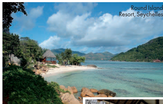
Round Island Resort, Seychelles

Pentru o vacanță completă, petreceți câteva zile în Orașul Luminilor (și al modei!) – Paris –, iar apoi continuați-vă călătoria către paradisul tropical din Insulele Seychelles, considerat cel mai frumos arhipelag din lume. Sejurul parizian vi-l puteți petrece la hotelul Shangri-la, Mandarin Oriental sau la Four Seasons, situat la câțiva pași de celebrul bulevard Champs-Élysées. Construit în anul 1928, hotelul are o arhitectură unică: este decorat în culori pastelate și împodobit cu picturi din secolul al XVIII-lea. Iar spa-ul și sala de fitness sînt recunoscute ca fiind cele mai luxoase din întregul Paris. Dar oricît de tentant ar părea să vă petreceți zilele pariziene lenevind într-un spa, vă propunem să ieșiți din hotel și să descoperiți frumusețea orașului făcînd o plimbare în grădinile Luxembourg sau Tuileries și bucurîndu-vă de un picnic în doi în Place des Vosges, loc de înfîlire pentru parizieni atunci cînd răsare soarele. Luvrul, Muzeul Picasso sau Turnul Eiffel sînt locurile care nu trebuie să lipsească din itinerariul vostru (chiar dacă par niște clișee turistice!). Iar amatorilor de artă contemporană