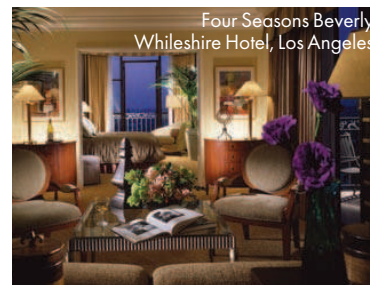
Four Seasons Beverly Whilesire Hotel, Los Angeles

Ai vrea să-ți petreci LUNA DE MIERE sau vacanța mult așteptată, alături de iubitul tău, într-un loc cu adevărat special? Nu poți alege între un PARADIS eco și un oraș cosmopolit, unde să te bucuri de tot rafinamentul unui hotel cu un DESIGN exclusivist? Sugestiile ELLE îți demonstrează că le poți avea pe amândouă!