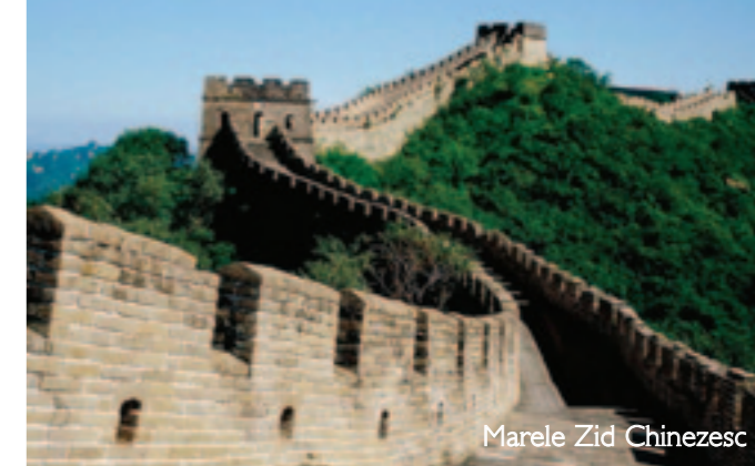
Marele Zid Chinezesc